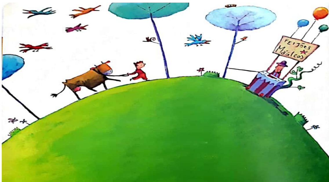
Ilustração de Jean-Claude R. Alphen